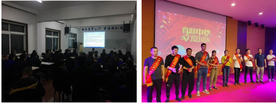
图表6.1-1 员工学习活动案例

对于员工，公司始终“诚信则立，和谐则昌，共赢则广，健康则富”的企业精神，致力于打造一个和谐的工作环境，让员工轻松地工作和生活。