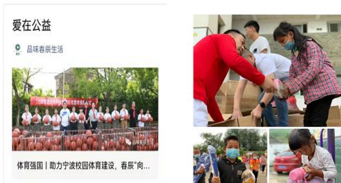
图表7.1-2 内部募捐案例